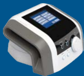
BTL-6000 Lymphastim 12 TOPLINE