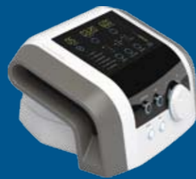
BTL-6000 Lymphastim 6 EASY